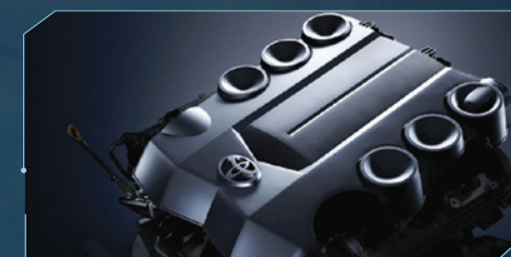
*VVT-i: Sincronización variable e inteligente de las válvulas.

El nuevo sistema VVT-i* Dual ofrece un control totalmente variable sobre la sincronización de las válvulas de admisión y escape, con una alta potencia y torque, una excelente eficiencia de combustible y bajas emisiones de escape a través de toda la gama de revoluciones. El resultado es una experiencia de manejo potente y sensible que hace honor a la herencia de Prado.