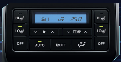
Mandos de aire acondicionado para segunda fila. Foto de referencia

El aire acondicionado automático con control de 3 zonas, ofrece un ajuste de temperatura independiente para los ocupantes. Cuenta con filtro eliminación de polen que permite que todos se sientan más cómodos a bordo minimizando las impurezas.