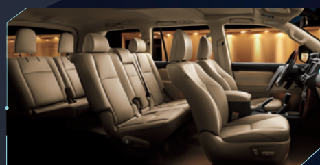
Foto muestra cojinería de referencia

Con Prado, tienes convenientes características y flexibilidad en la configuración de asientos que pueden satisfacer las necesidades de una diversa gama de situaciones de tu estilo de vida.