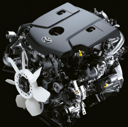
Imágenes de referencia

Hilux cuenta con varias alternativas, motor diesel con Turbo de Geometría Variable en versiones 2,4L y 2,8L ; motor gasolina VVT-i Dual en versión 2,7L y motor de 6 cilindros en línea de 4,0L, que mejoran notablemente la aceleración en bajas y medias velocidades y el rendimiento de combustible.