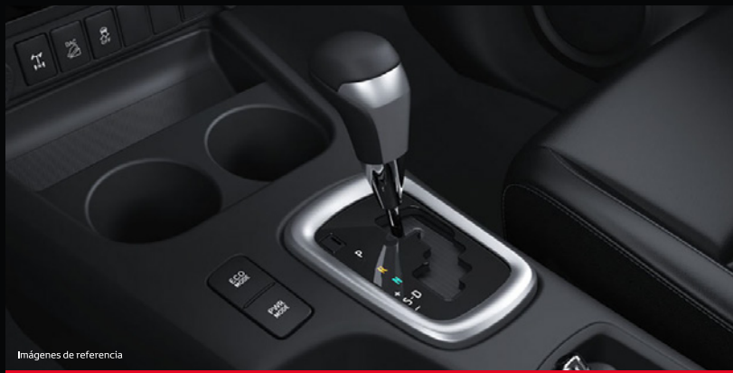
Imágenes de referencia

La Nueva Hilux cuenta con transmisión manual (M / T) de 6 velocidades en la versión diesel 2,4L y de 5 velocidades en la versión gasolina 2,7L. La transmisión automática (A / T) de 6 velocidades aplica para la versión diesel 2,4L, 2,8L y 4,0L. Gracias a sus nuevas relaciones, reflejan todo el potencial del motor y mejoran el rendimiento del combustible.